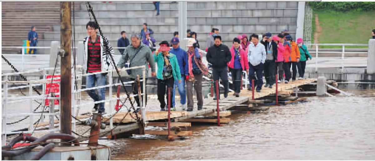
4月22日下午,长沙市湘江风光带帆船广场,游客沿着浮桥观光。当日,湘江水位离广场二级平台只差50厘米左右。