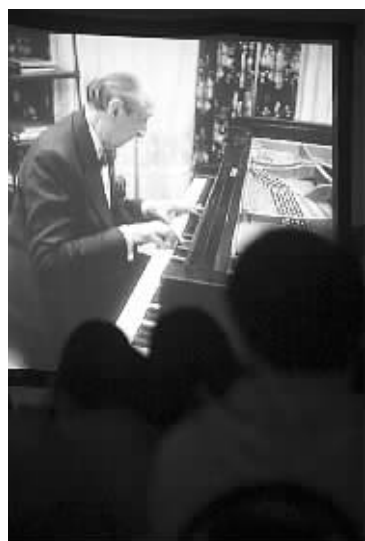
老霍的《梦幻曲》，令人痴醉。

今天我介绍的是非常值得一提的现场版《梦幻曲》，是大钢琴家霍洛维茨在莫斯科音乐会现场演奏的。老霍的《梦幻曲》一直是一个“传奇”的版本，据说每一次演奏都有很大的不同。我就多次听到过他完全不同的绝妙演奏。其声部、音乐线条和气息的把握变化万千，体现出惊人的控制能力和强大的艺术感染力，也在演奏中形成了一个绝妙的“音场”。用心聆听老霍演奏的《梦幻曲》，我相信你会重新认识伟大的音乐家舒曼。