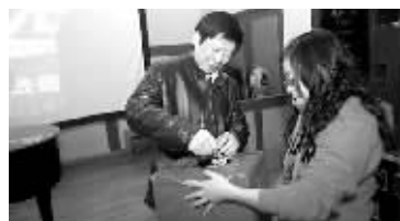
爱乐签名，看谁最幸运。