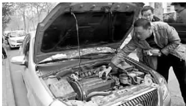
安阳一位车主对记者表示，“对于车辆因红色汽油导致的部件受损问题，目前中石化还没有给出一个明确的说法。”

中石化河南石油分公司目前也声明表示，已组成调查组，最终调查结果待专家及权威机构拿出意见后及时公布。