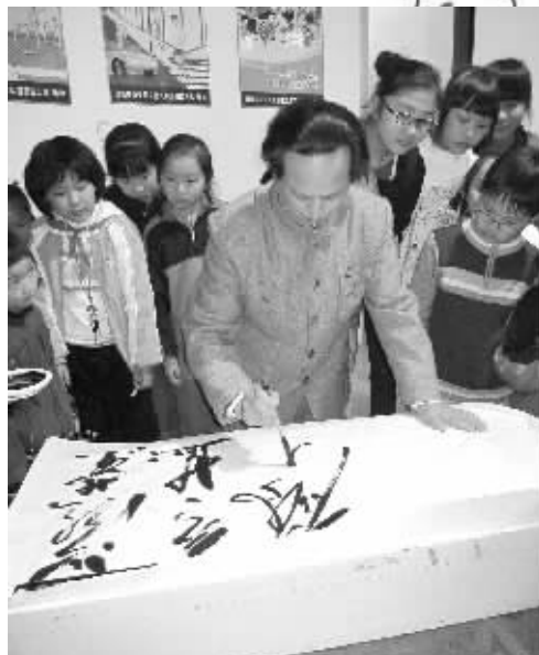
“毛主席”在表演书法。