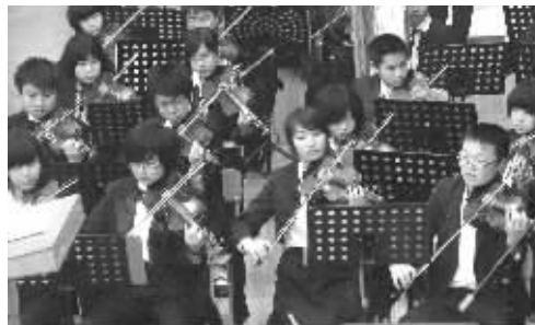
雅礼中学雅礼交响乐团在演出。