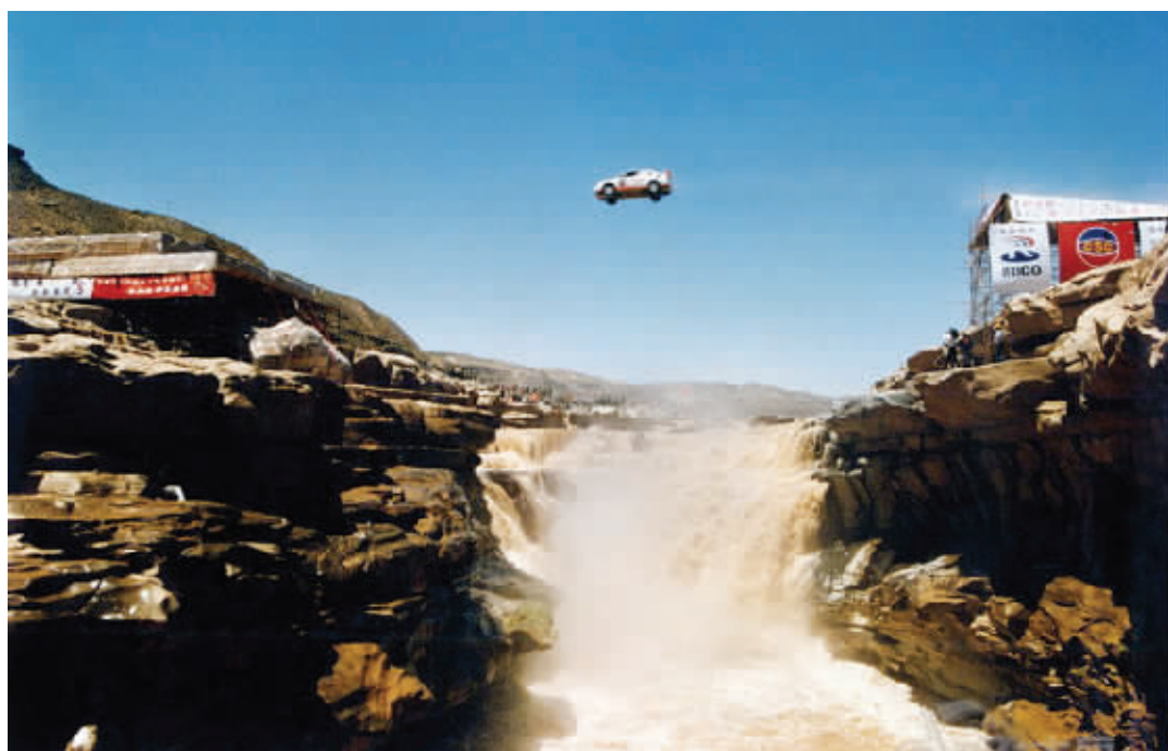
柯受良首次飞越黄河。