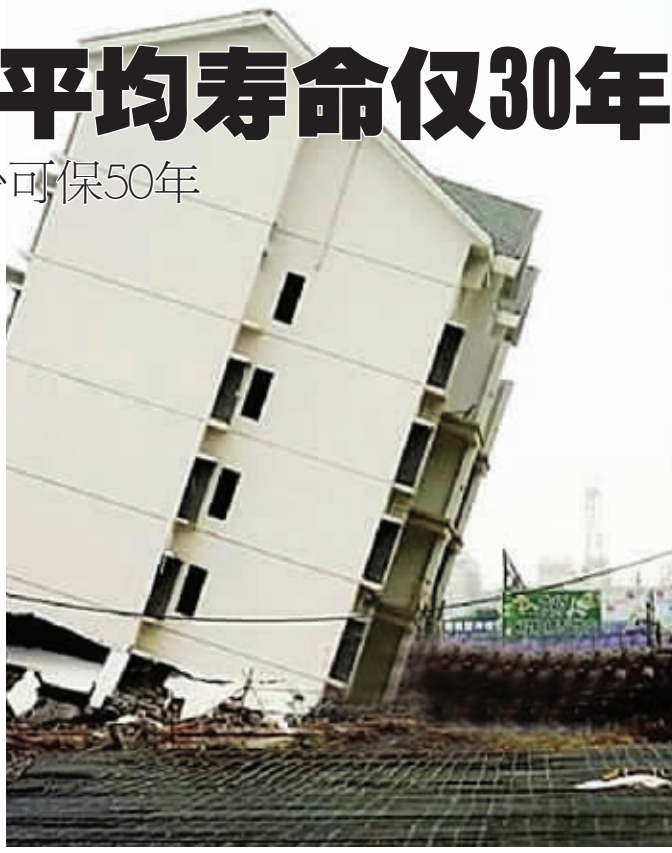
4月1日18时左右,广西南宁市一小区一栋6层新楼爆破后倾而未倒,呈40度角倾斜,随即该楼照片开始在网上传,被称为广西“楼歪歪”。