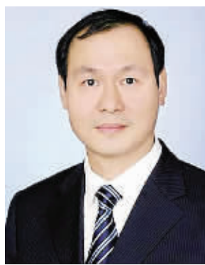
谢再兴：原温州市瓯海区区委书记。曾挂职浙江省委组织部组织处副处长。