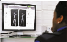
机场使用全身透视X光机。