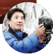
■本版图片摄影/赵勇