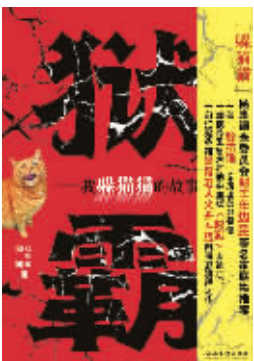
《狱霸》 白露、刘念国 著 湖南文艺出版社