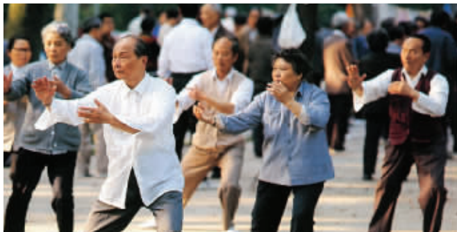
老年人锻炼宜选温和为主要的运动。

另外,春季饮食应避免吃生冷油腻之物,要食富含维生素B的食物和时令新鲜蔬菜。适当多吃些种子类食物或者豆浆,种子中蕴含着生机,有助于机体的生发之机。