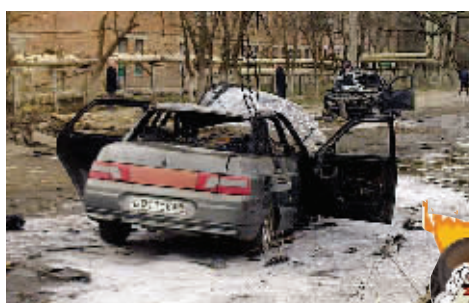
俄罗斯达吉斯坦共和国基兹利亚尔市的爆炸现场。