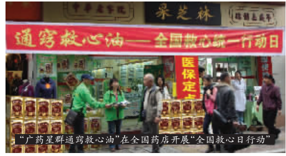
“广药星群通窍救心油”在全国药店开展“全国救心日行动”

1月29-31日广药集团广州星群药业在全国重点药店开展了“星群通窍救心油——全国救心日行动”。