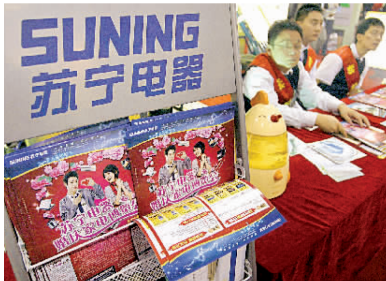
苏宁电器一贯坚持“以顾客需求为导向”的服务理念。