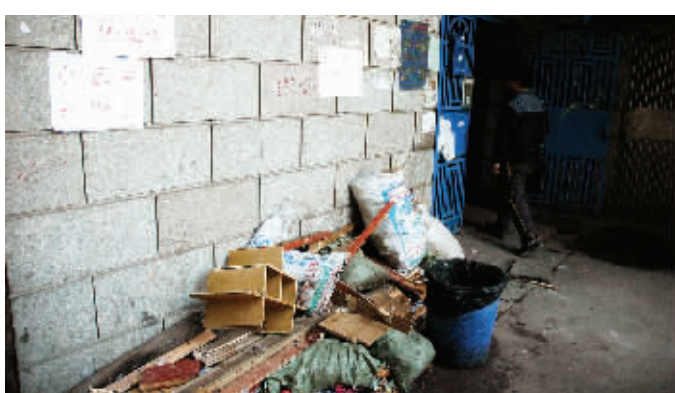
小区内散落着住户们的生活垃圾。

目前，小区业委会下一步准备召开业主大会，成立小区自治筹备组，并由社区监督管理，到期出示支出清单。“接下来就要等华荣物业、牛角塘社区、雨花区房地局三方与小区业委会召开协商会，决定谁来负责接管小区，走一步算一步吧。”