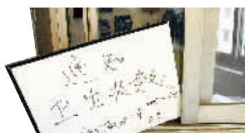
大门口窗户上挂着一张业主委员会通知业主们交纳卫生费的通告牌。

近日，管理长沙赤岗冲恒达时代花园的华荣物业公司却把小区业主给“炒”了，原因是近五分之一的业主拖欠了公司50万元的管理费。