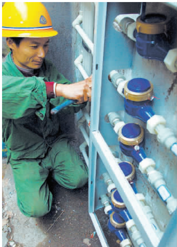
代表建议,长沙供水供电实施一表一费制。(资料图片)

此外,可规定住户自行持IC卡主动直接到供水供电公司购水购电,对于未达到一户一表的供水供电标准的情况,应逐步加以改造,在改造完成之前,应由政府统一要求供水公司和供电公司提供上门收费的责任,如果供水公司、供电公司需要委托物管公司收费,则供水公司、供电公司不应以“物管公司挪用水电费”为理由停水停电。同时,实行政府定价,任何人不得随意加价。