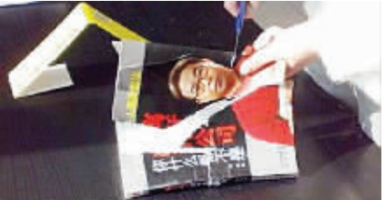
一名女子拿着剪刀剪下封面人物头颈。

“我竟然什么都不是？”为了发泄自己的不满，“悬崖的柔情”开始对这本书百般折磨。图片显示，一名年轻女子拿着剪刀