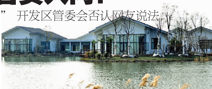
网友提供的图片显示：水面波光粼粼，岸边白房黑瓦，几丛芦苇随风摆动，环境清静幽雅。