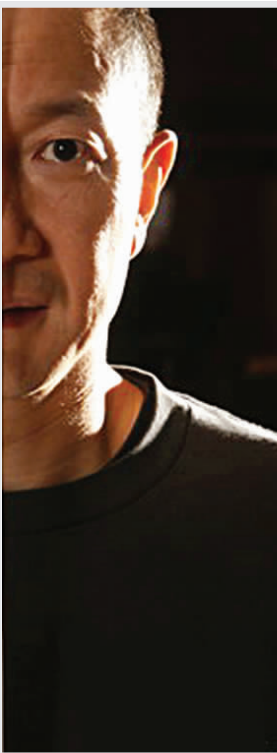
谭盾(右)和《阿凡达》。他们代表的两种文化力量的碰撞和交融将是21世纪全球文化语境的主题。