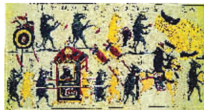
滩头年画中著名的“老鼠娶亲”图,是鲁迅先生最喜欢的民间工艺作品之一。

有一个谜题吸引着很多专家学者来解答:中部湖南为什么能在短短几年里实现文化的跃进?