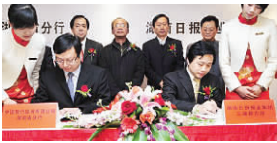
2009年12月8日,中行湖南省分行与三湘华声签订战略合作协议。

2006年,湖南日报报业集团。一家名叫“华声在线”的网站在一间小办公室悄悄开张。短短三年后,它跻身全球十大中文社区、中国十大门户网站,并与三湘都市报、华声手机报、每日传播网组成了三湘华声全媒体,打造了全媒体的传播链条,开创了“报网融合”的新纪元。三湘都市报与华声在