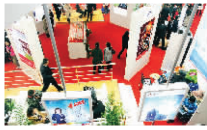
2009年湖南首届金融博览会在长沙红星国际会展中心隆重举行。