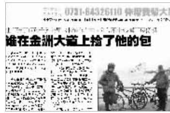
本报2009年12月22日A13版报道。