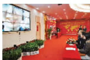
视频面试招揽顶尖人才——长沙首次。(资料图片)