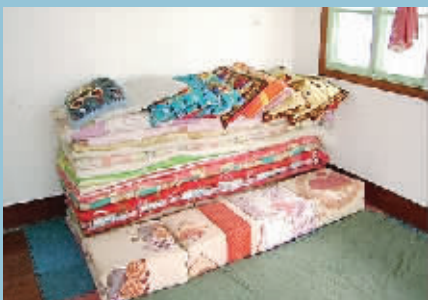
二十几个男女挤在一间房打地铺,被絮叠得整整齐齐,据“经理”称,大家都是一个人,要团结在一起。