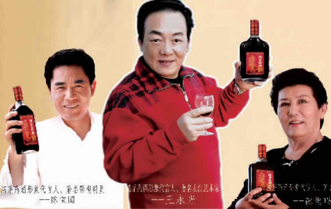
鸿茅药酒形象代言人、著名影视明星 —— 陈宝国 鸿茅药酒形象代言人、著名表演艺术家 —— 三永光 鸿茅药酒形象代言人、著名歌唱家 —— 德德玛

鸿茅药酒距今有270年历史，十八步69道古法炮制工艺结合高新科技生产而成，67味中药精华，借酒力充分发挥效力，滋肾阴、健脾胃、祛风寒、除湿邪，活血通络，宜痹定痛，调节五脏六腑功能，强健筋骨，从根源上治疗老风湿、重症风湿等病，不添加任何西药成分，真正的治病药酒，品质信得过。