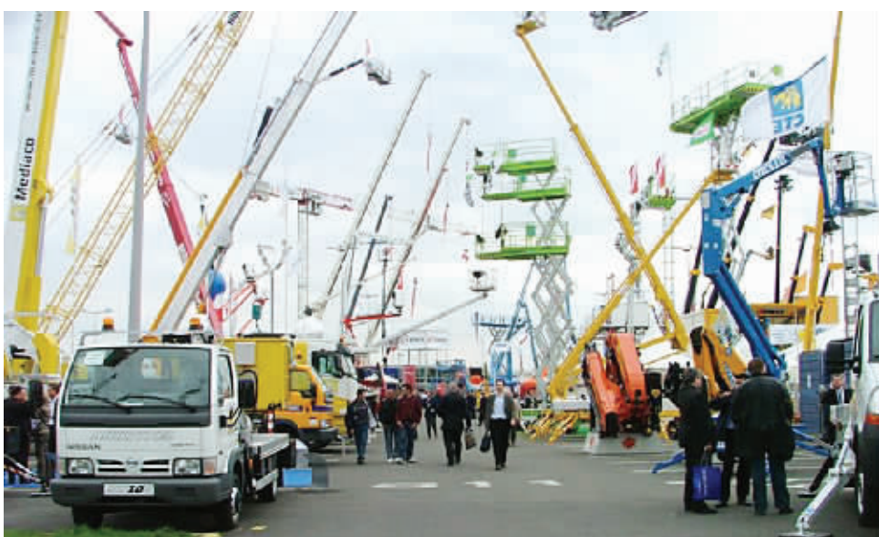
意大利CIFA被中联重科并购后渐入佳境。(资料图片)