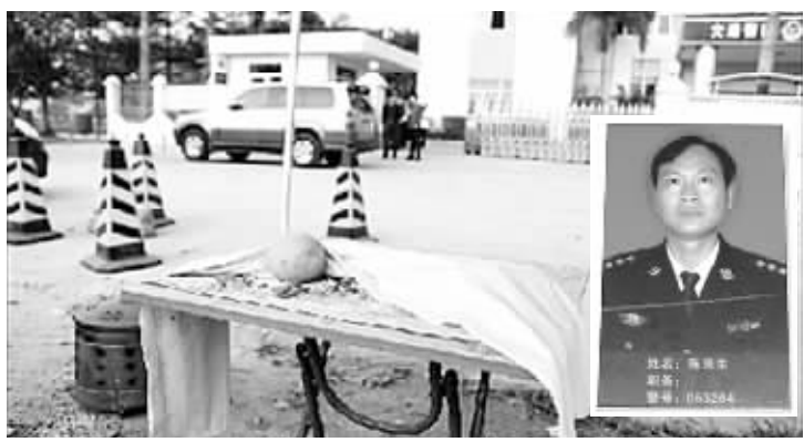
死者家属在警队里大办丧事。