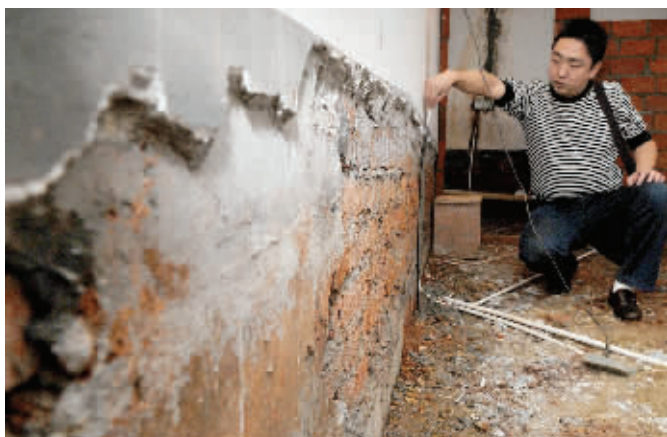
长沙市竹满人家小区,2米高车库被挖出2.8米层高,车库往下挖了0.8米深。