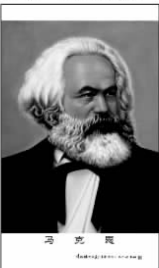
北京 国际共产主义运动五伟人·彩色瓷像 创作年代:1967年 规格:72CM x 43CM x 5 估价:RMB 3,800,000-6,000,000 (五伟人粉彩瓷像板画之一:马克思)

这场拍卖会最为重要且最瞩目的拍品,当属中国现当代瓷像瓷画的一代宗师吴康在1967年创作的“国际共产主义运动五伟人”当像瓷板画。这套瓷像瓷画被认为是新中国陶瓷艺术史上的标志性作品,估价高达380-600万元,可谓现当代陶瓷艺术中的天价作品。这套在文革初期创作的瓷像瓷画三件包括毛泽东、恩格斯、列宁、斯大林及毛泽东在内的五位领袖,画面栩栩如生,达到了逼真与形神兼备的艺术效果,其色彩的丰富性及肌理质感的精纯度都显示了吴康像瓷画艺术全盛期的艺术高度。特别是这套全套的领袖瓷像瓷画作品作为“文革艺术”的代表之作,更从强烈的时代特征上见证了中国文革时期独特的历史与文化。