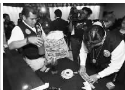
秘鲁警方破获一起犯罪团伙杀人抽取受害者脂肪贩卖案件。这种人体脂肪可用于化妆品制造业，在黑市上每公升可卖到1.5万美元。

——鸡皮疙瘩起啦一身咧。我以后只用郁美净宝宝霜好嘛，几块钱的化妆品应该有用人油做吧？