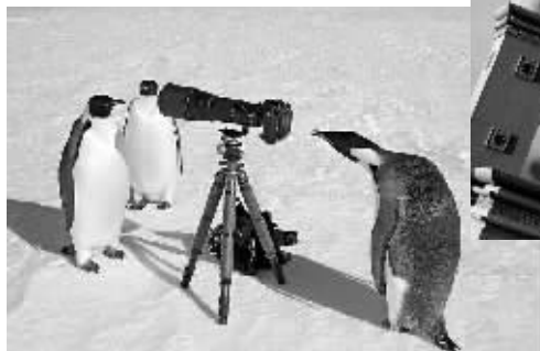
摄影师大卫·舒尔茨在南极拍到了几只帝企鹅，用他的相机拍照留念的照片。