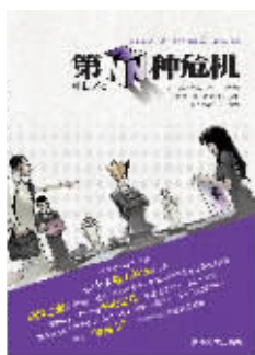
《第N种危机》叶耘著 清华大学出版社

想知道何抑扬与柴扉这对欢喜冤家更多的故事么？移动手机用户可以编辑CS+真实姓名+本报当日头版喷码发送到1065800078462抢书并注明“危机”，可登录网站http://sxwtfk.voc.com.cn抢书。幸运读者将获得《第N种危机》图书一本。