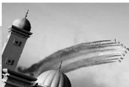
2009年第十一届迪拜国际航空展上，意大利特级飞行表演队在空中划出彩虹般的图案。