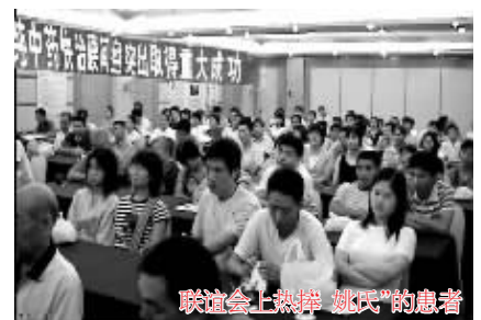
联谊会上热捧“姚氏”的患者

一种针对根本的中药，要达到最终的效果，是需要一定时间的，绝不是十天八天就能达到的，俗话说“伤筋动骨一百天”；另一方面说，腰椎间盘突出不是细菌或病毒感染，不是说短期内用高效药杀灭细菌病毒就治好了，而是要依靠药物慢慢溶解吸收突出物，逐渐脱离神经压迫，绝对是需要一定时间的。我要告诉大家，要么你不要选择“姚氏”，如果服用了，那么请遵医嘱严格按疗程服用，服够三个疗程，不要自行停药。