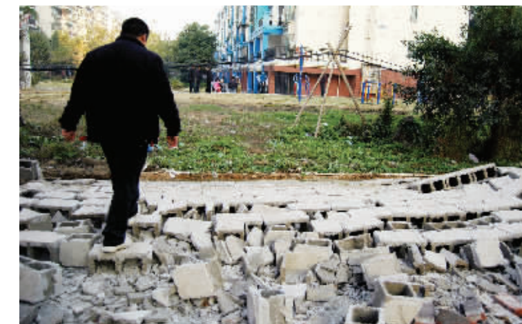
11月24日,长沙市开福区政府旁的江滨玫瑰园小区内,一位居民从被推倒的围墙上走过。