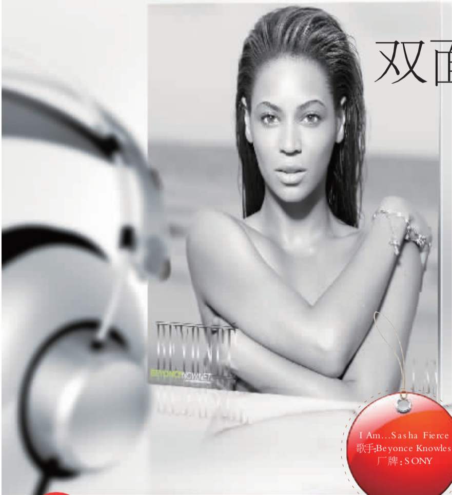
I Am...Sasha Fierce 歌手: Beyonce Knowles 厂牌: SONY

舞台上的艳光四射,舞台下的情深似海。先是婉约腼腆地倾诉,然后活蹦乱跳外加男女调情。这张专辑浓缩了真实的碧昂斯,她原本就是双面的,就像在北京演唱会上,当碧昂斯身着火辣高叉,全场一起K起柔情绵绵的《if iwere a boy》的时候,温柔的挑逗,完美的结合,突然想起了某个乐评人的预言“这个姑娘一定会红,就像布兰妮一定会黑。”