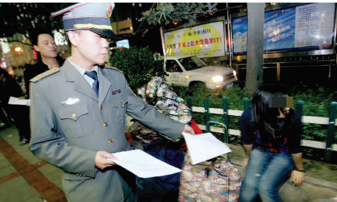
10月28日晚,长沙市五一广场。城管执法人员下发文件通告给五一广场周边的流动摊贩