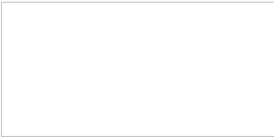
“孪生兄弟”摆在一起让人难辨真假

头偶遇爱车孪生兄弟,都未能追捕成功。 今日下午2时许,孪生兄弟在东塘联通营业厅门前的停车坪再次偶遇。车主报警了,经核查,这台黑色尼桑天籁不但套牌还有走私嫌疑,被交警部门当场暂扣。截至记者发稿,被扣车主一直没有现身。 今年6月1日以来,长沙交警支队接到群众举报100余起,查处涉牌涉证交通违法行为600余辆次,其中套牌车就有200辆。“群众发现套牌车,可以拨打24小时开通的122举报电话。”为了加大对套牌、假牌、挪用号牌、无牌无证车辆的打击力度,交警部门将重点在高峰时段巡查整治,深入郊区以及车站、停车场、洗车场、二手车交易市场、餐饮娱乐场所等巡察。