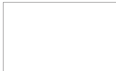
建设中的江神庙前街

建成主体的庙前街,背后便是正在喷漆上窗的江神庙。目前江神庙已全新亮相,正在进行细节装修。该景点也将在年底开门迎客。