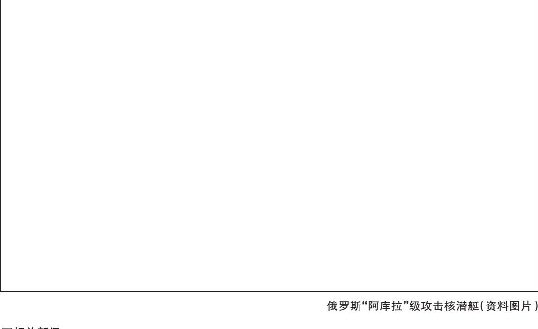
俄罗斯“阿库拉”级攻击核潜艇(资料图片)

美国国防部官员4日称,两艘俄罗斯核动力攻击型潜艇已在美国东海岸的公海上徘徊多日。美国官员称,自冷战结束之后从没见过如此不寻常的举动。