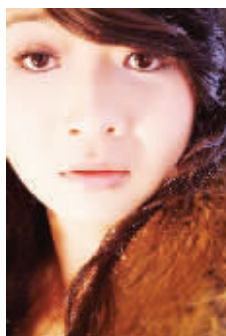
宅女达人: 布丁 自由职业

推荐理由: 我很喜欢娇兰年轻系列的产品, 而看准一套装带回家觉得很划算, 娇兰完全深彻靛白保湿乳液, 适合所有肤质, 兼具美白和保湿双重功效, 在家里把一整套系列完整做下来后, 令肌肤白皙晶莹有如花瓣般丝滑柔软。