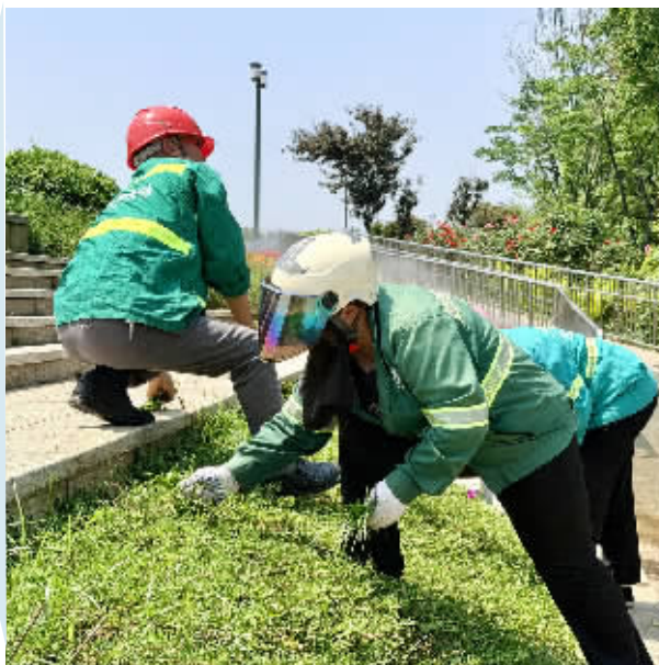
6月3日上午,湘江新区园林绿化维护中心潇湘大道管理所的园林工人在除草、修剪绿篱。