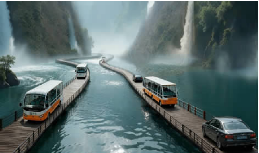
古丈白溪关腾龙谷景区1800米峡谷浮桥效果图。