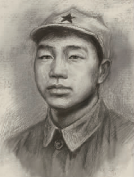
陈宜胜素描画。羊咪米绘