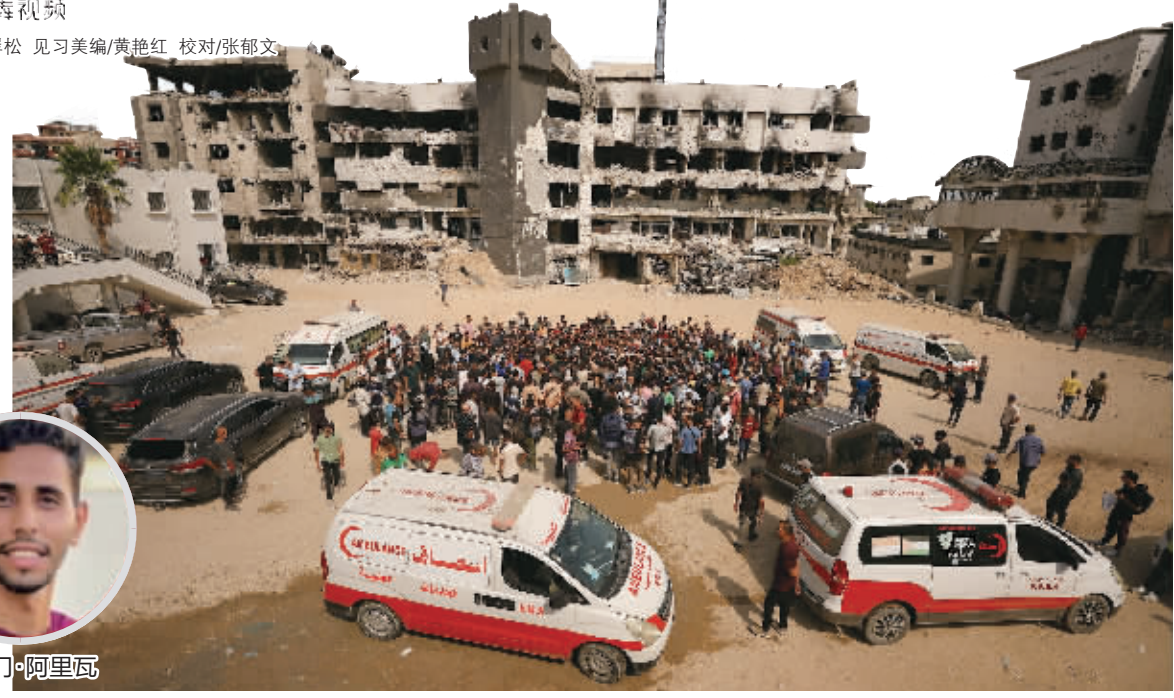
8月11日,在加沙城,人们参加遇难记者的葬礼。