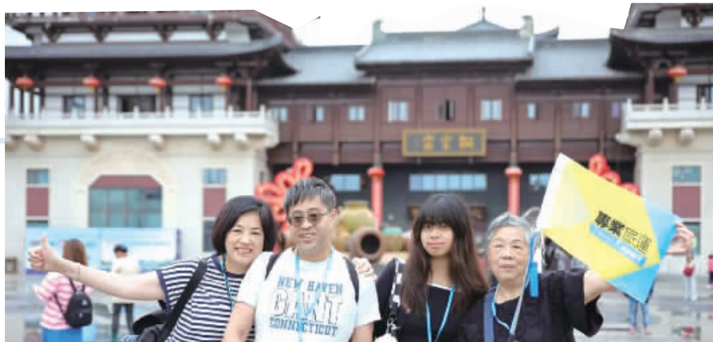
香港游客打卡长沙铜官窑景区。