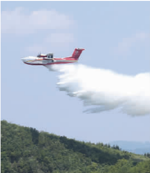
AG600飞机在陕西蒲城开展负过载科目试飞。