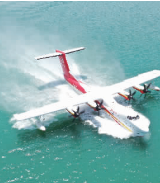
AG600飞机在湖北荆门开展水上科目试飞。