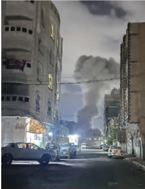
3月19日，也门首都萨那一处地点遭到美军空袭后升起浓烟（手机照片）。

对于此次群聊泄密事件，参议院情报委员会民主党首席议员马克·沃纳说，如果普通军官或情报人员有这种行为，他们早就被解雇了。一名俄勒冈州民主党参议员表示：“应该有人辞职，首先应从总统国家安全事务助理和国防部长开始。” 美国布鲁金斯学会高级研究员达雷尔·韦斯特对记者表示，这一事件是“一场灾难”，显示出“高度的业余”。韦斯特说，通过非安全渠道进行如此重要的对话是“天真的做法”。 美国圣安塞尔姆学院政治学教授克里斯托弗·加尔迪耶里对记者表示，内阁成员和国家安全官员都有安全的设备和场所开展此类对话。“这种（在非保密渠道沟通的）做法令人震惊。”加尔迪耶里说。 ■据新华社