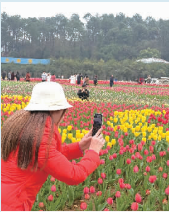
游客在省植物园拍摄盛开的郁金香。

该局还将全力做好跟踪服务。在全省设置5个大学生创业县市区级联系点,及时收集辖区内大学生创业主体的总体经营、吸纳就业、税收社保缴纳、获取贷款等情况及存在困难问题、意见建议,建立跟踪服务机制,及时解决创业主体困难。