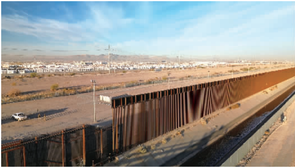
这是1月22日在美国得克萨斯州埃尔帕索拍摄的边境情况(无人机照片)。

美国白宫新闻发言人1月22日说，总统唐纳德·特朗普已指示增派1500名军人赴美国南部边境，以协助确保边境安全。当天，墨西哥开始在边境地带设立庇护设施，为应对美方可能实施的大规模驱逐非法移民政策做准备。