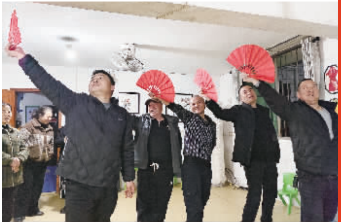
黄氏家族正在紧锣密鼓地进行“春晚”排练。