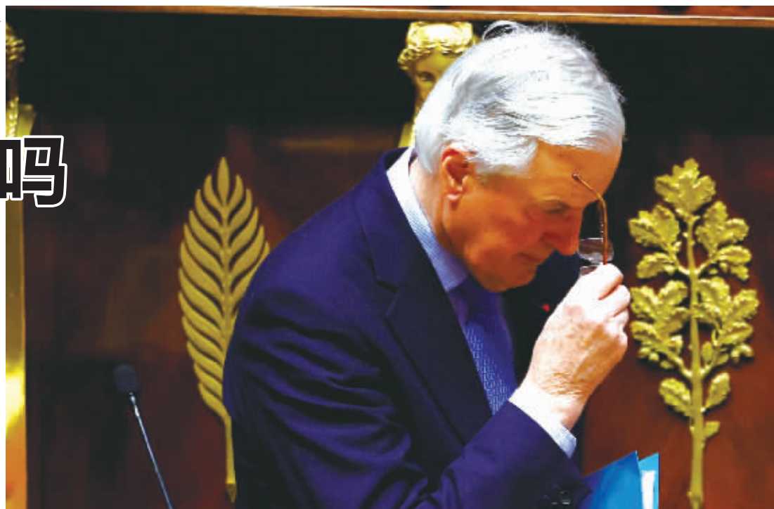
12月4日,在法国巴黎,法国总理巴尼耶在国民议会就政府对不信任动议投票表决前的辩论上发言后离开。

今年6月和7月,法国提前举行国民议会选举。新一届议会中,马克龙倚靠的中间派失去多数地位,与左翼、极右翼形成三大阵营。 按照惯例,巴尼耶内阁辞职后,在新总理任命之前将继续负责日常政务和应急管理。 有专家认为,近年来,法国两大传统政党社会党与共和党轮流执政的两极格局逐步瓦解,取而代之的是左翼、中间派和极右翼“三足鼎立”的新格局,法国政党政治呈现日益碎片化和极化的发展态势。 ■据新华社