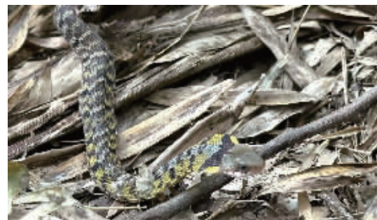
藏在枯枝落叶间的崇安斜鳞蛇。