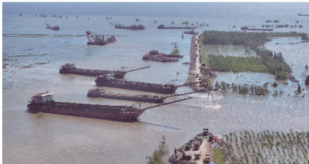
7月7日,在华容县团洲垸洞庭湖大堤决口现场,抢险队伍在进行堵口作业。