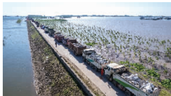
7月6日,华容县团洲垸,装满石块的车辆在决口附近排队。