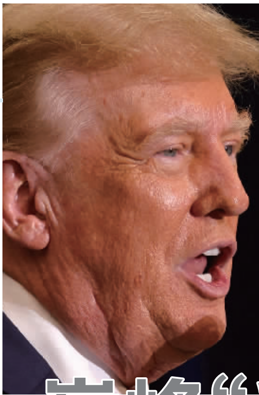
共和党总统候选人特朗普。