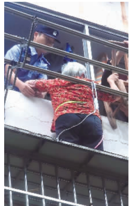
施救现场。