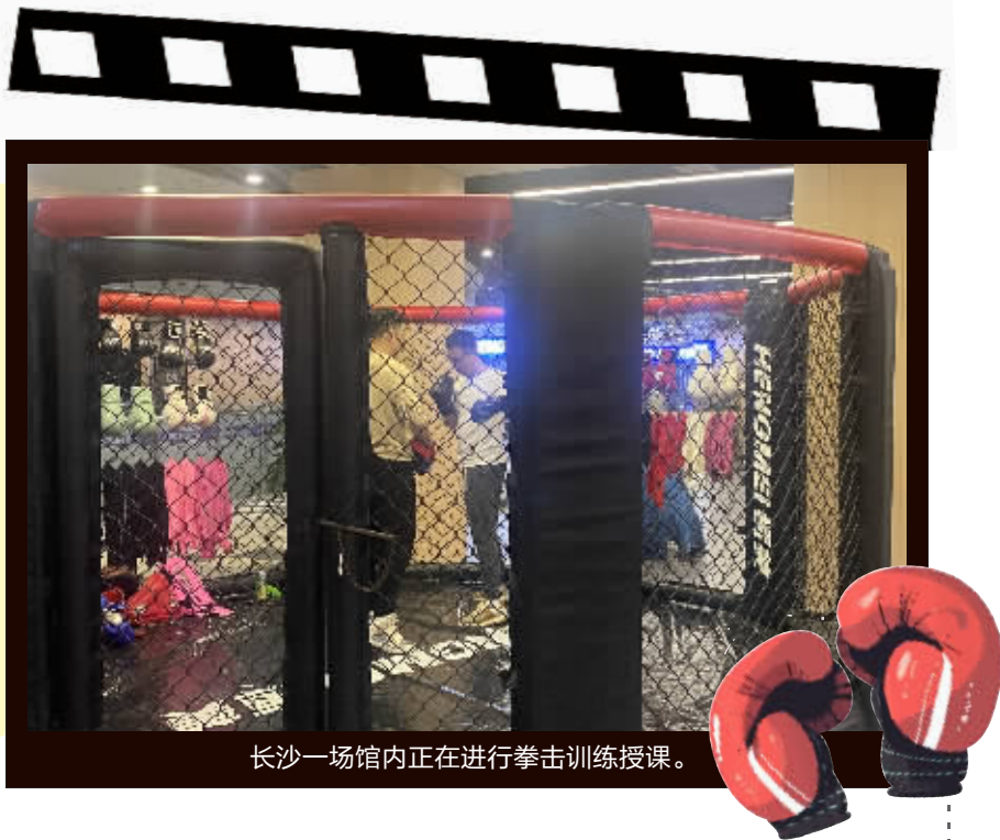
长沙一场馆内正在进行拳击训练授课。