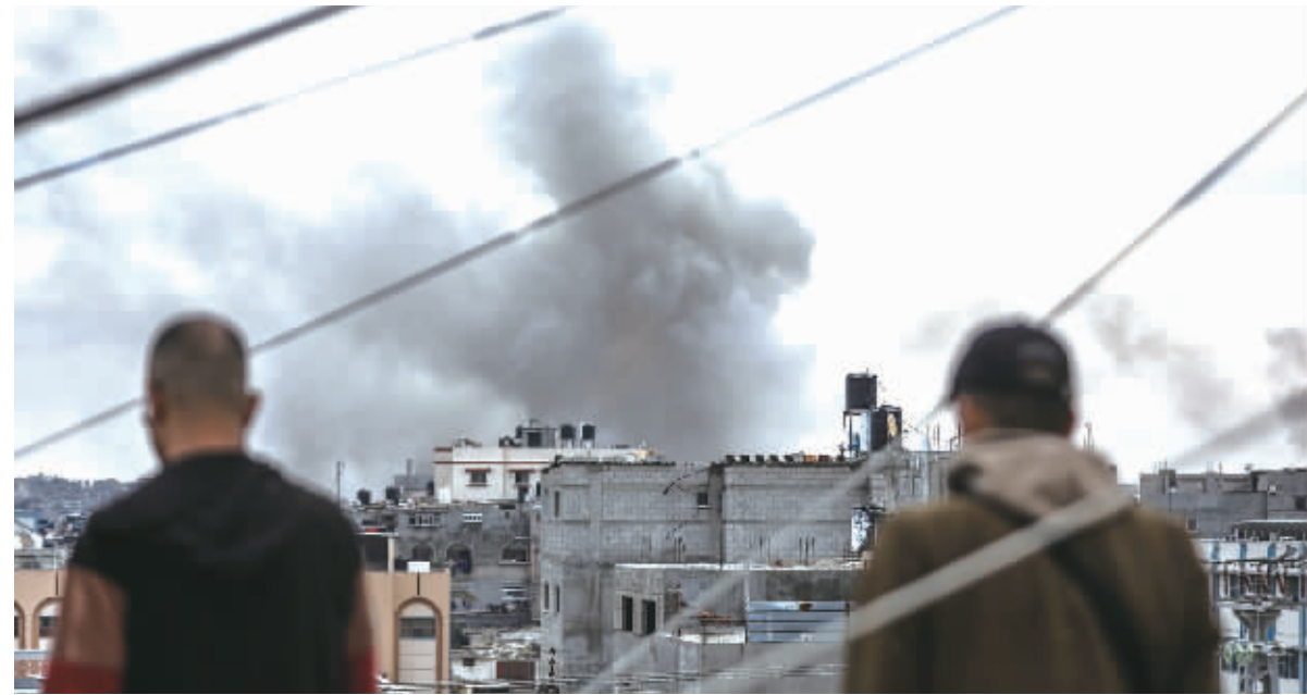
1月21日,加沙地带南部城市汗尤尼斯在遭遇以军空袭后升起浓烟。新一轮巴以冲突爆发以来,加沙地带共有超过2.5万名巴勒斯坦人在冲突中死亡。以色列方面说,冲突造成1300多名以色列人死亡。